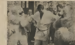
ANTON Y E. OSONAN Doce di pusha dia oso fei

Cu un anuncio den "Observador" bo venta ta superior.